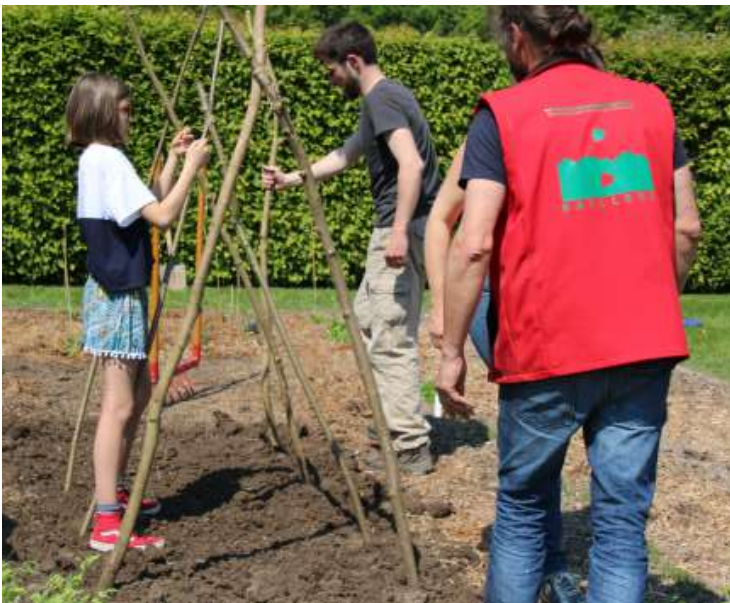
18 avril 2019 : création d'un potager au naturel