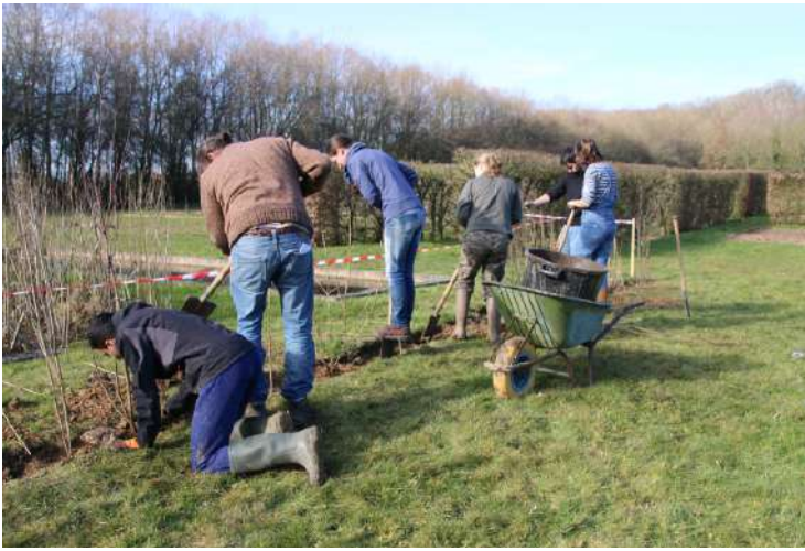
21 février 2019 : plantation d'une haie avec des essences issues de la marque « Végétal local ».