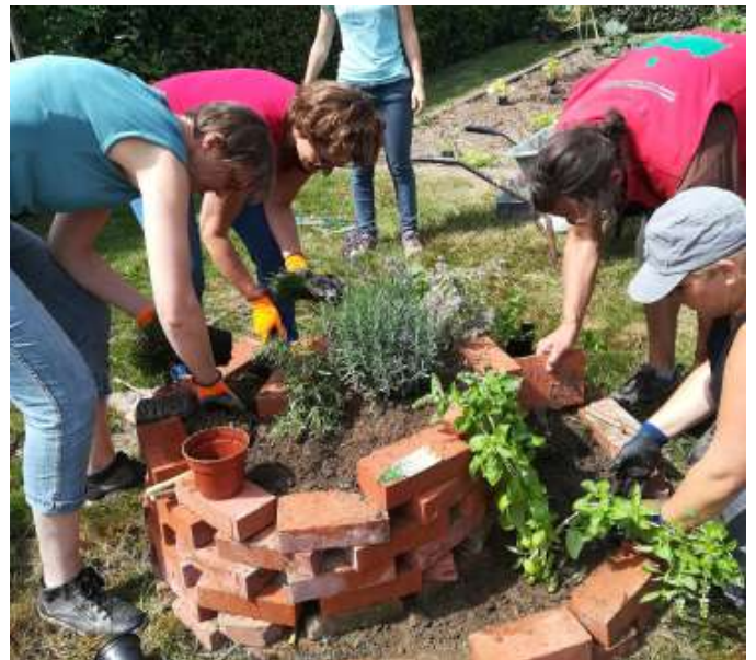
8 juillet 2019 : création d'une spirale d'aromatiques