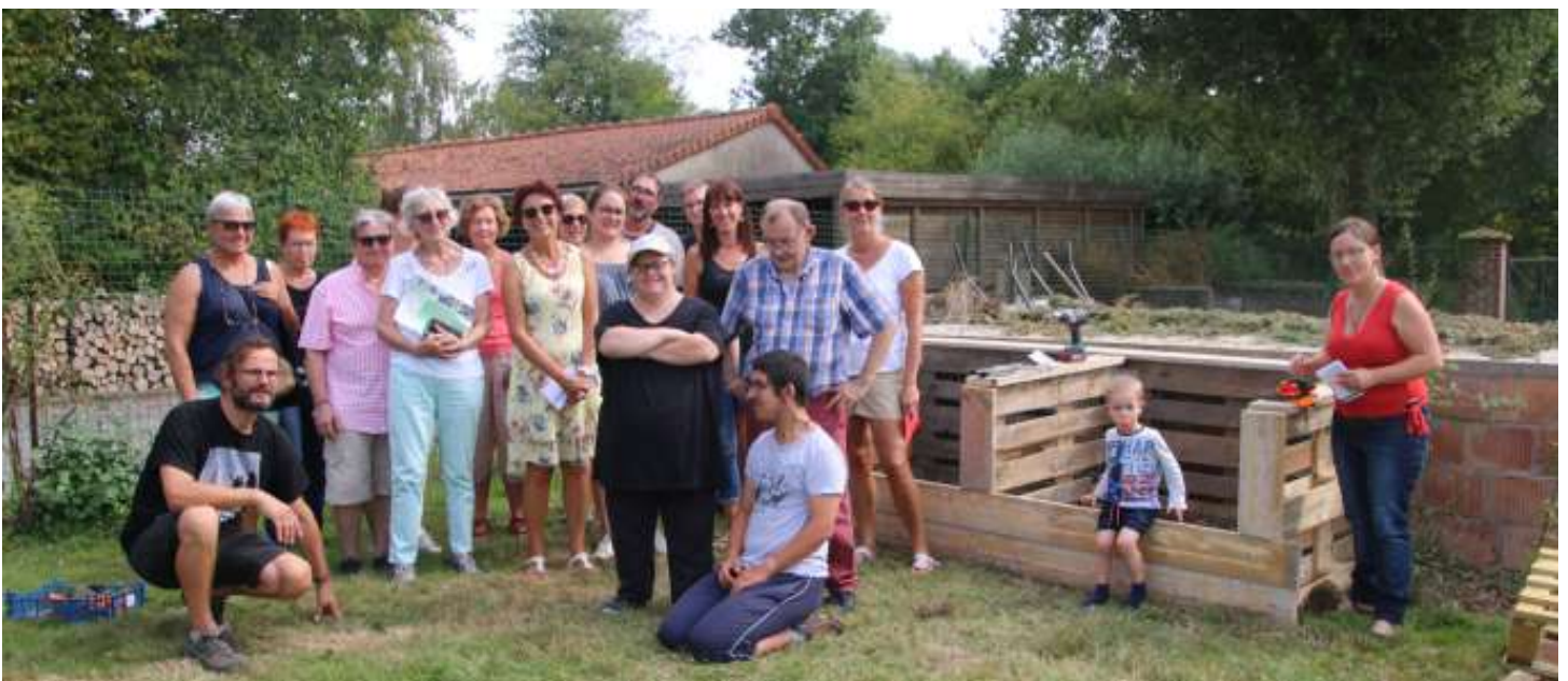
28 août 2019 : création d'un composteur en bois de palettes