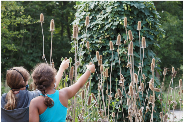
Animation autour des cinq sens