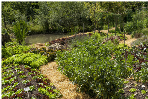
Création d'une butte en permaculture