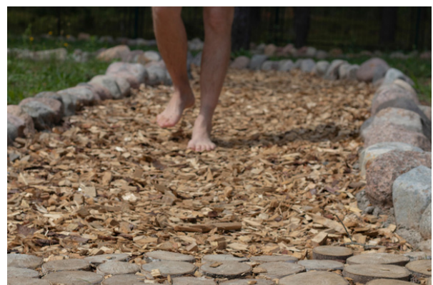
Production d'un chemin de « va-nu-pieds »