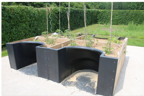
Récolte des légumes, des fruits du verger