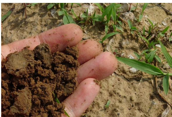
Analyse d'un sol (strates d'un sol avec une caisse en bois)