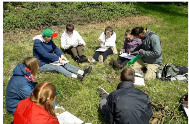
Animation « réveil sensoriel »