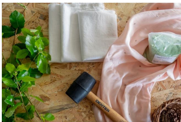
Impression végétale sur tissu à partir d'éléments végétaux