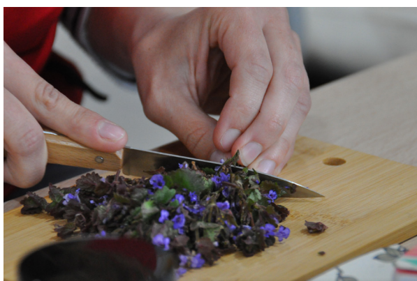
Atelier fabrication de remèdes avec des plantes sauvages