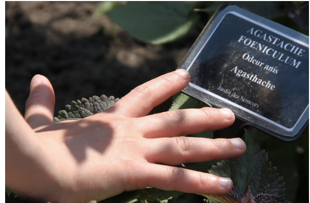
Animation autour du toucher (yeux bandés)