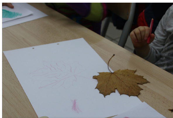
Fabrication d'un herbier de feuilles et de fleurs sauvages