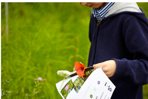
Création d'un herbier vivant olfactif et sensoriel