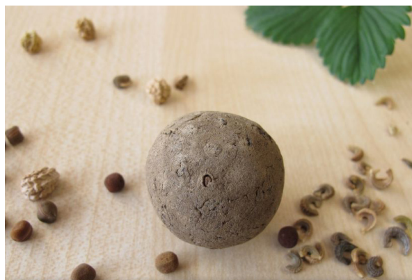
Fabrication de bombes de graines de plantes sauvages