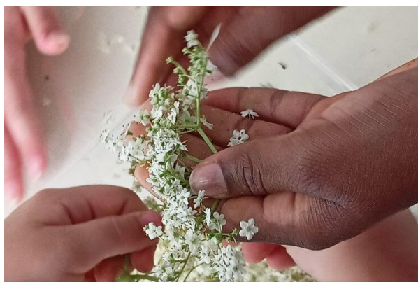
Ateliers cuisine de plantes sauvages