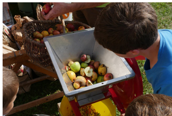
Fabrication de jus de pomme