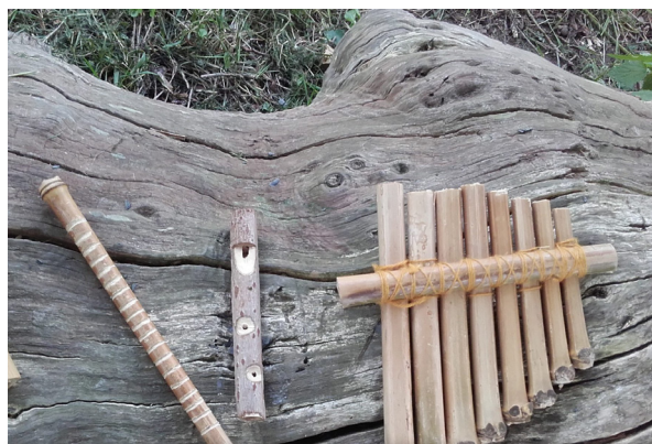
Fabrication d'instruments de musique avec des éléments naturels