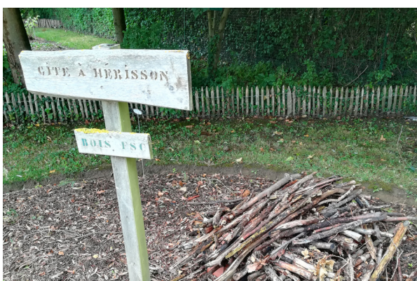
Fabrication de gîtes à insectes, hérisson, etc.