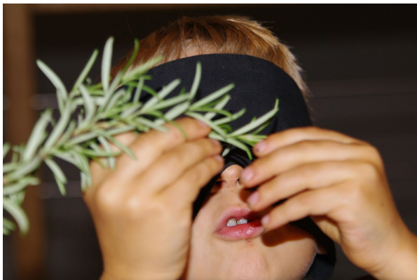
Animation autour des odeurs