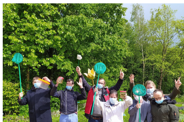
Identification des insectes (filet à papillons, boîte d'observation...)