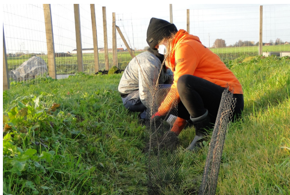
Semis de fleurs sauvages et plantations d'arbustes