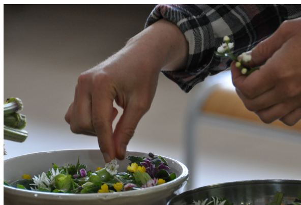
Atelier cuisine de plantes sauvages (jus, sirop, pesto...)