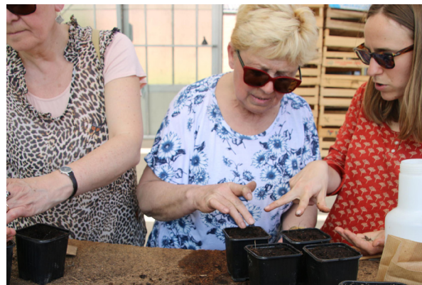
Semis de légumes sous serre ou en pleine terre