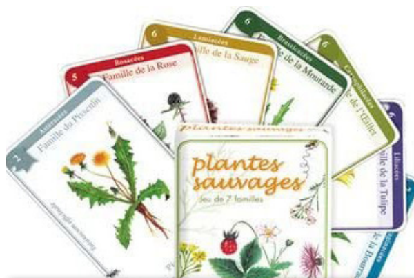
Jeu de 7 familles des plantes sauvages et mémo plantes sauvages