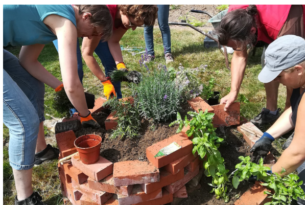
Fabrication d'une spirale d'aromates