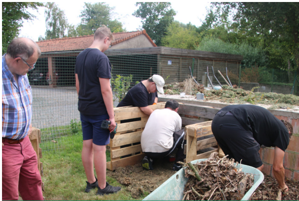
Analyse d'un compost et observation des petites bêtes du compost