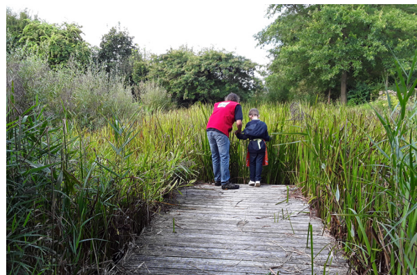
Animation sur les batraciens autour de la mare