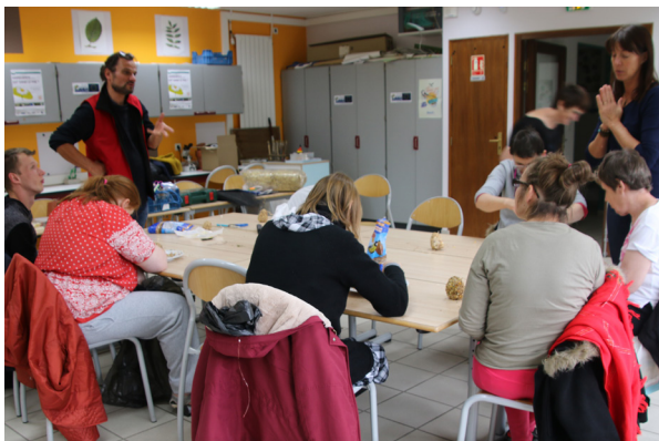
Fabrication de mangeoire ou de boules de graisse