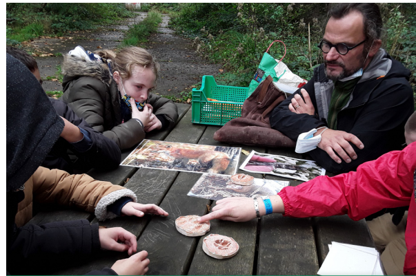
Atelier fabrication d'empreinte d'animaux