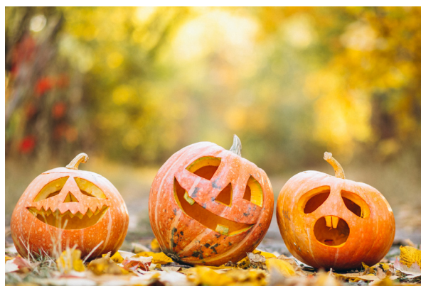
Décorations d'automne autour des courges