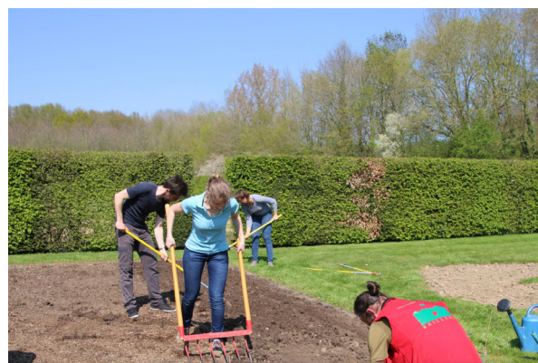
Soin du potager (arrosage, désherbage, etc.)